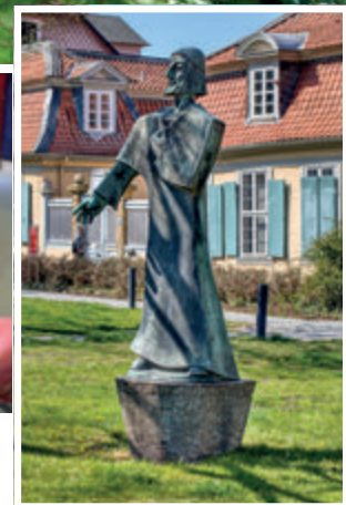
Was darf's denn sein? Kulinarik oder Kultur? AHA-Erlebnismuseum oder Lessinghaus?