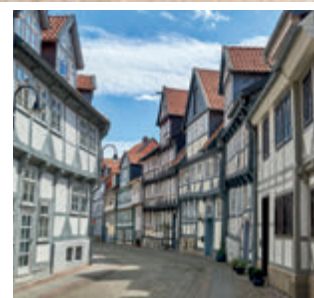
Rund 1.000 Fachwerkhäuser gibt es in Wolfenbüttel