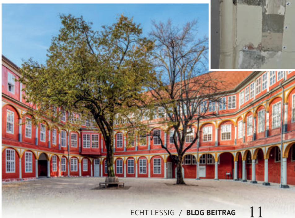
Ein Probenfenster im Schloss Museum