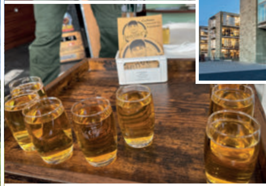
Jägermeister – 56 Kräuter erobern die Welt

Zu jeder Jahreszeit empfehlenswert: das Allwetterbad Stadtbad Okeraue mit Cabriodach.